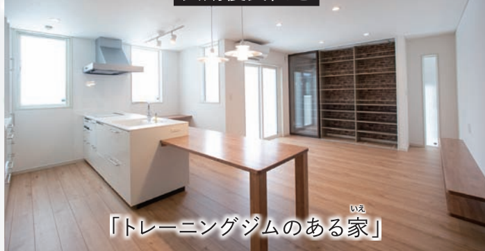
いえ 「トレーニングジムのある家」