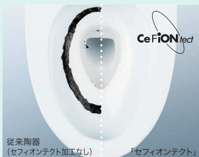
従来陶器 (セフィオンテクト加工なし)

陶器表面の凹凸を100万分の1mmのナノレベルでツルツルに。汚れが付きにくく、落ちやすいTOTO独自の技術です。