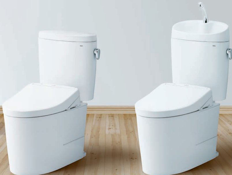
ピュアレストEX(手洗なし) セット希望小売価格 ¥304,000 (税抜き価格)